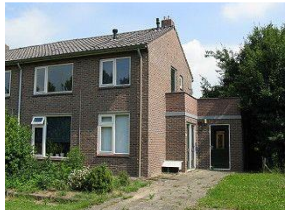
Toldijkseweg 5A en 7A