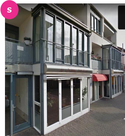
Van Cappellestraat 27 t/m 47 en 4 t/m 62