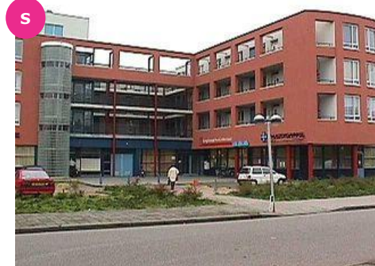
Amphionstraat 7 t/m 65