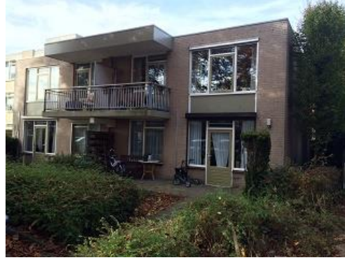
Steinlaan 16 t/m 48