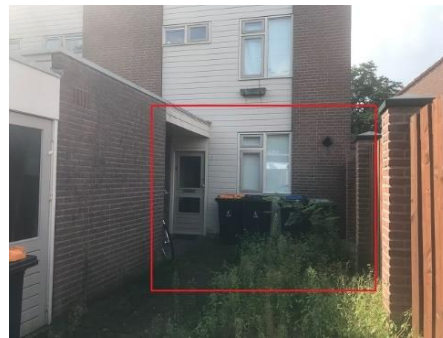
Javaplein 22 t/m 36