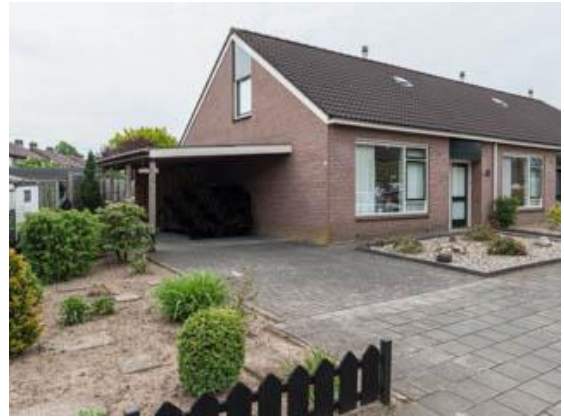
Hagelkruisweg 3 t/m 7