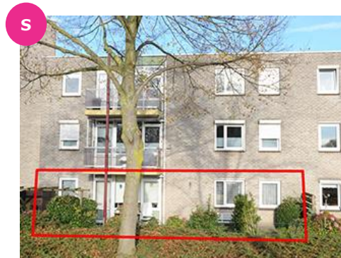
Rode Kruisplein 1 t/m 169 en 2 t/m 32