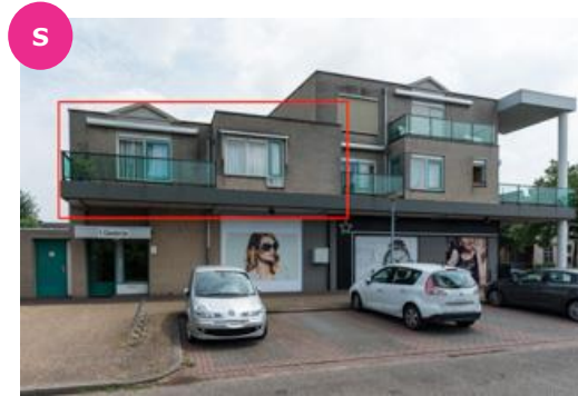
Van Damstr. 2-1 t/m 2-11