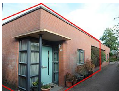
Hof van Rome 153 t/m 261