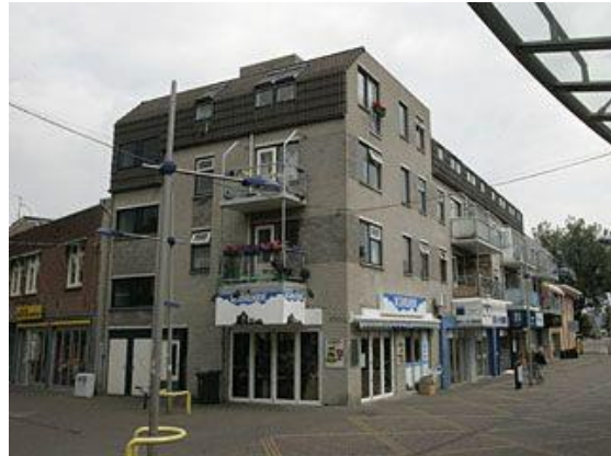
Korte Heezenstraat 8-01 t/m 8-19