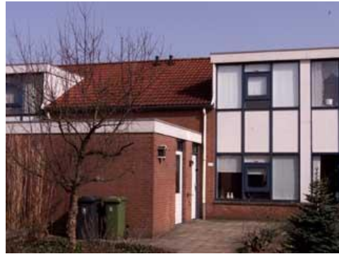
Blokhuislaan 175 t/m 223