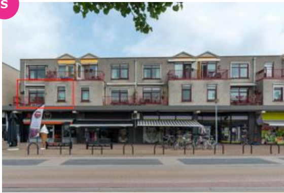
Hoofdstraat 1-3 t/m 1-26