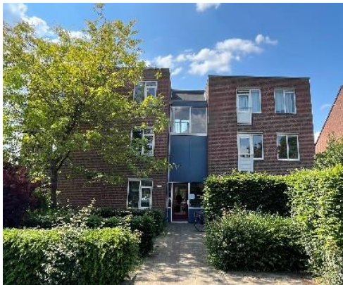
Eggedreef 1 en 3