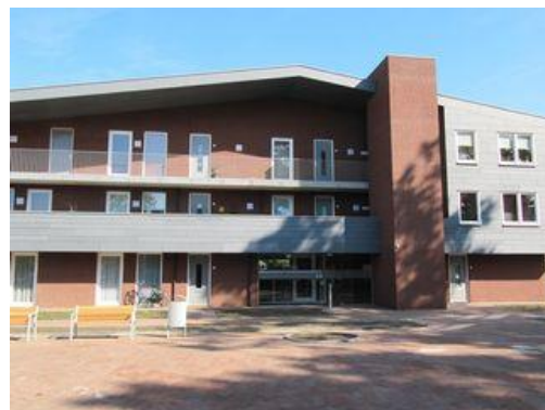
Zonneplein 8 t/m 78