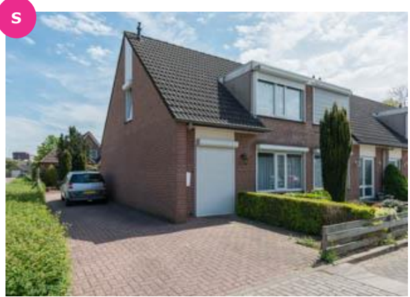
Olmenhof 1 t/m 15 en 2 t/m 28