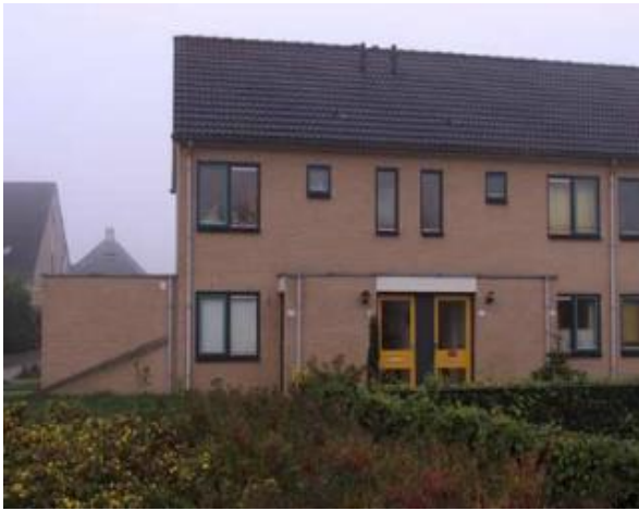
Meidoornstraat 17, 23, 25 en 31