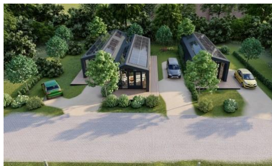
Dilleveld 2, 4 en 6