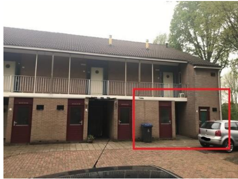
Bastinglaan 2 t/m 6, 20 t/m 24