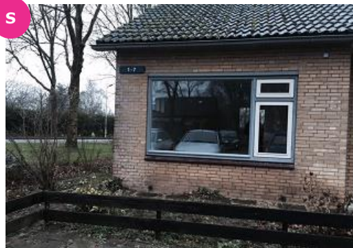
Priorstraat 1 t/m 7