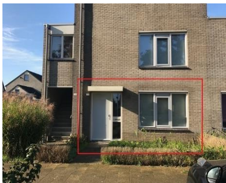
Kruidenlaan 112, 142, 146 en 156