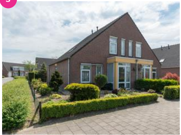
Lindenlaan 5 t/m 11