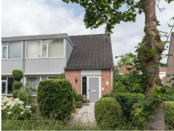
Gieterijstraat 2 t/m 12