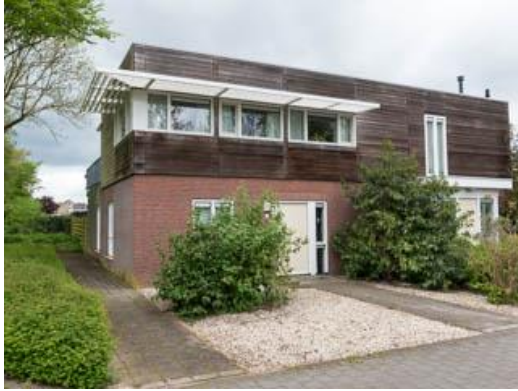
Slotlaan 51 t/m 69