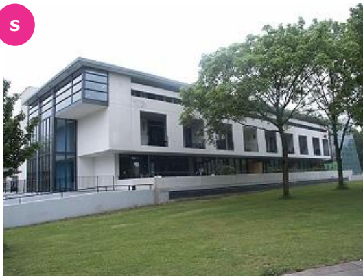
Dichterseweg 149 t/m 173