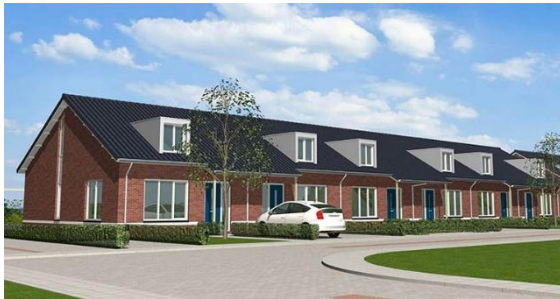
Neerlandiastraat 16 t/m 38