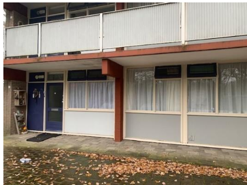
Verzetslaan 2 t/m 138