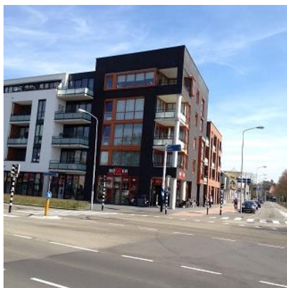
Dr. Huber Noodstraat 73-01 t/m 73-57