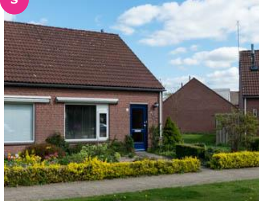
Gaffeldreef 14 t/m 20