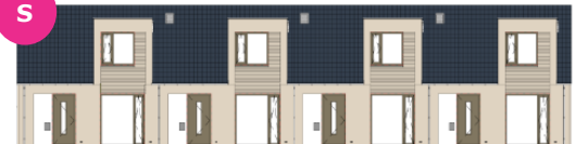
Hofstraat 48 t/m 54