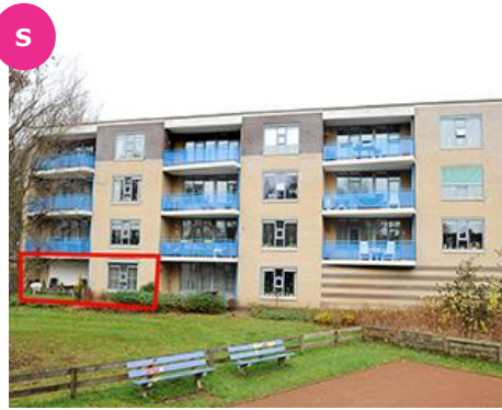
S Stevinlaan 11 t/m 47