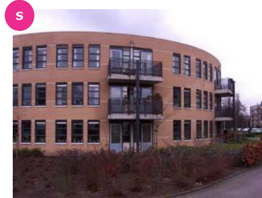
Den Uylplein 10 t/m 66