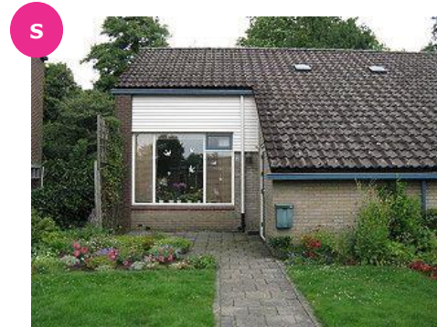
Schermhorst 49 t/m 119