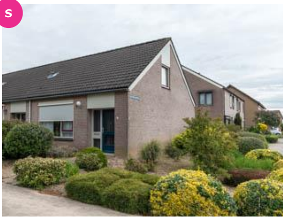
Nieuwe Kerkweg 18 t/m 20A