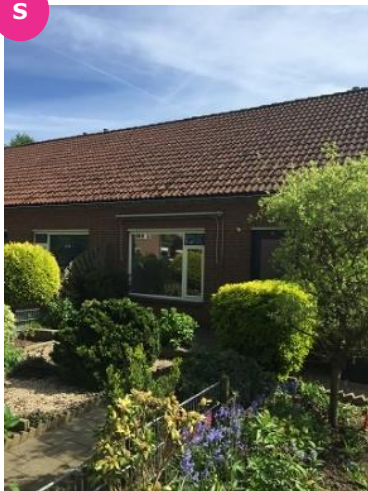
Eggedreef 74 t/m 78