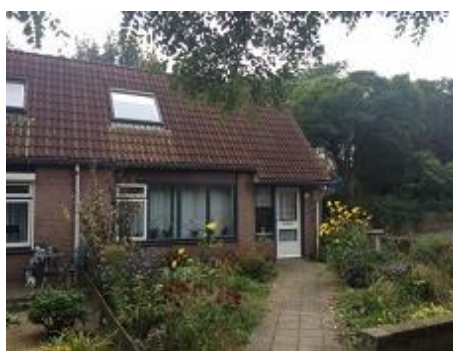
Sumatraplein 14 t/m 20