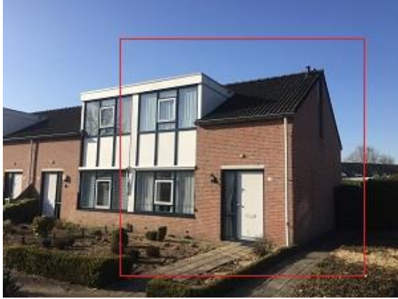
Vormerijstraat 72 t/m 84