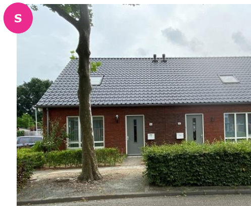
Leliestraat 82 t/m 88 en 110 t/m 116