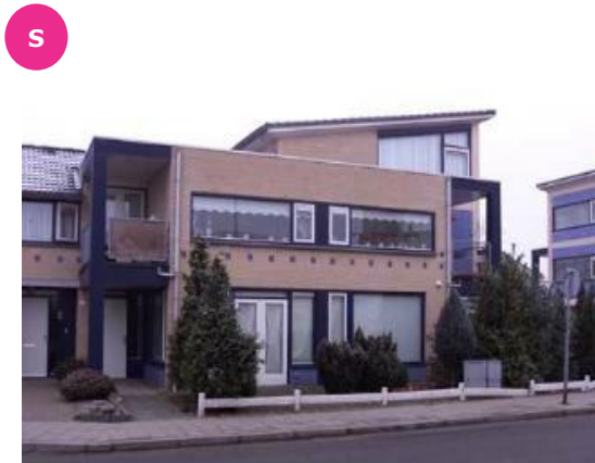
De Witstraat 1 t/m 35, 2 t/m 36