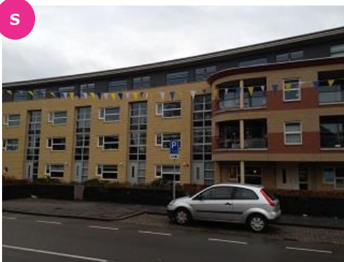
Rozengaardseweg 22 t/m 26 en 28-01 t/m 28-26