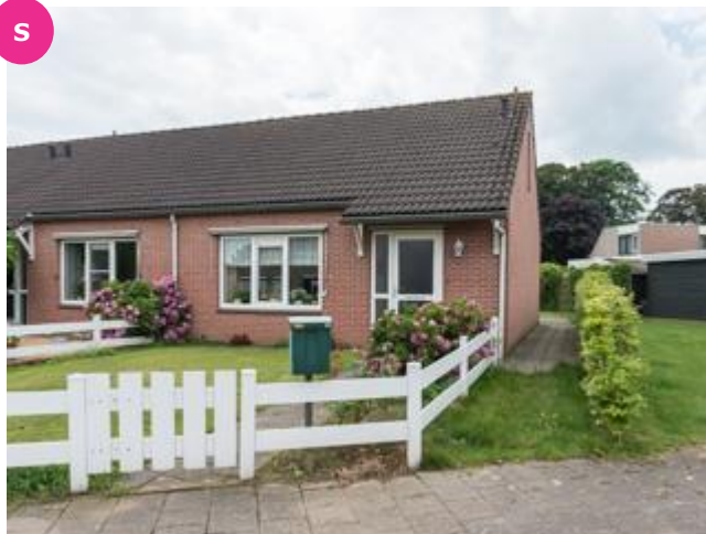
De Brouwerij 16 t/m 32