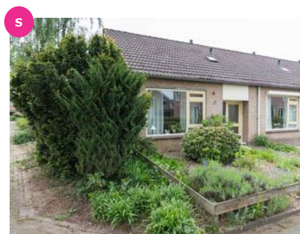
Steenbakkersveld 13 t/m 21 en 40 t/m 48