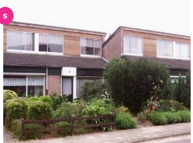
De Veldhof 1 t/m 15 en 2 t/m 14