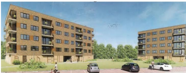
In aanbouw: Beethovenlaan, 70 app