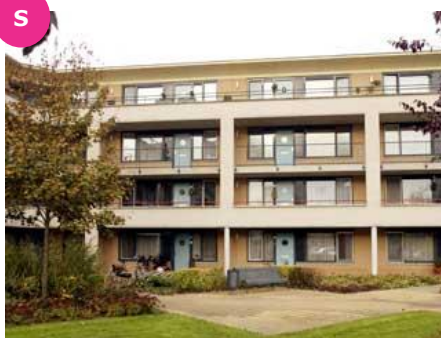
Hof van Oxford 2 t/m 110