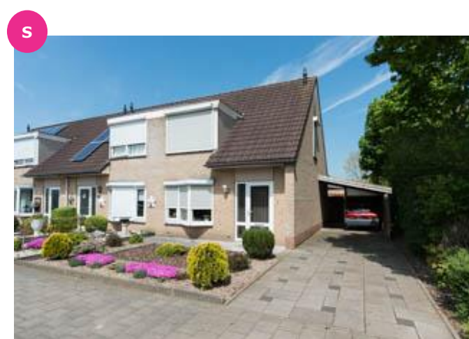
Berkenlaan 2 t/m 28