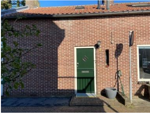
Brouwerskamp 33 t/m 83