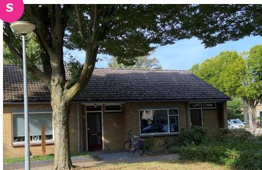
Ribesstraat 6 t/m 26