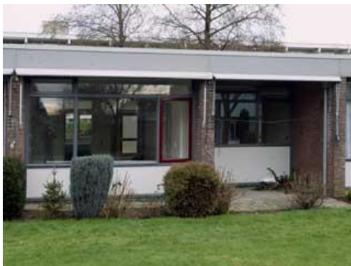
Multatulistraat 1 t/m 15