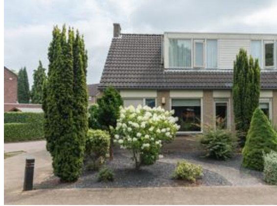
Vormerijstraat 42 t/m 54