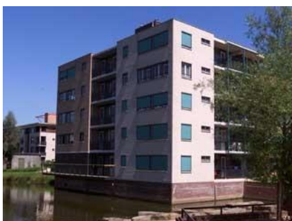
Hof van Oxford 146 t/m 178