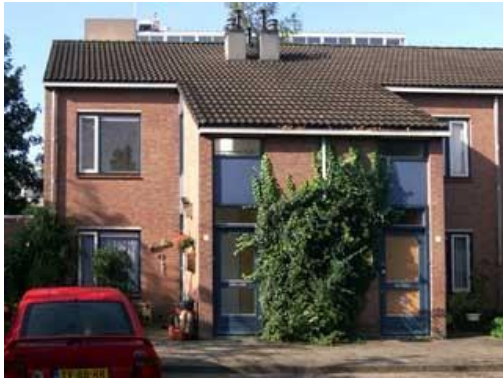
De Enk 1, 5, 9, 15, 17 en 23