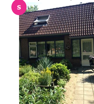
Sumatraplein 58 en 60