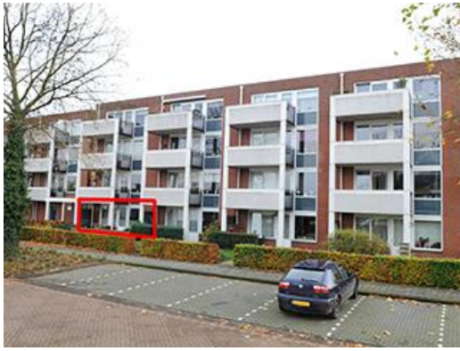
Vondelstraat 6-01 t/m 6-26