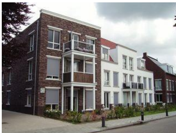
Stationsstraat 28-01 t/m 28-15