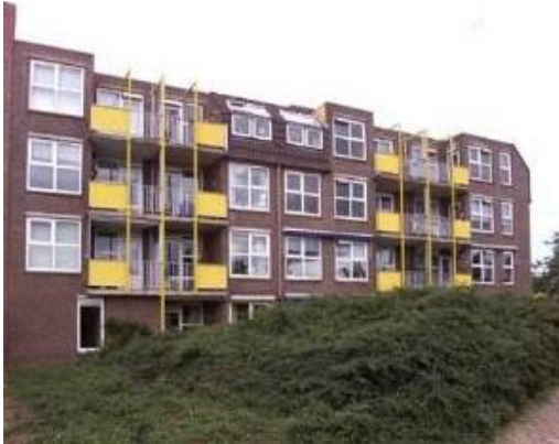
Gasthuisstraat 20 t/m 170