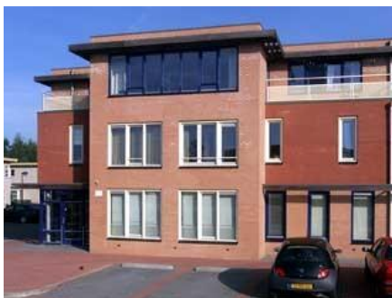
Hof van Parijs 2-01, 32-01 en 34-01