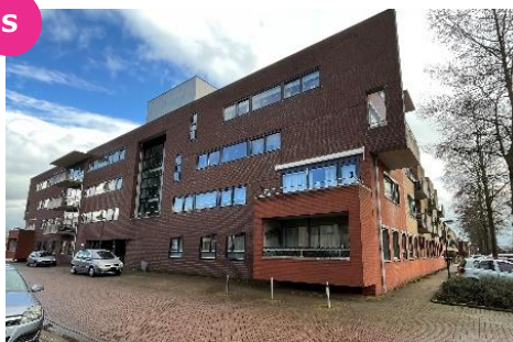
A. Mozerplein 51-01 t/m 51-29