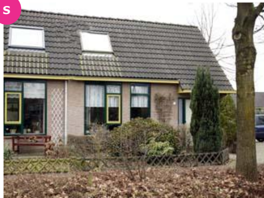
H. Dunantlaan 2 t/m 24