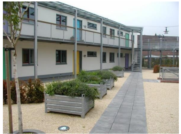
Het Breukink 2 t/m 22, 26 t/m 30 en 3, 5 en 11