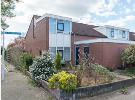
Appelbloesem 41 t/m 57