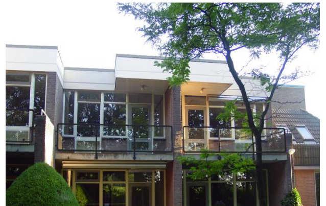
J.D. Pennekampweg 17 A t/m 17 H