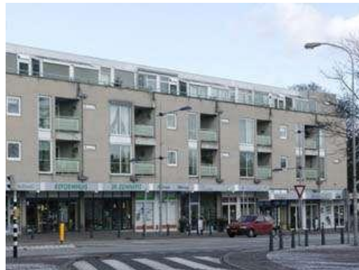
Raadhuisstraat 3-01 t/m 3-26