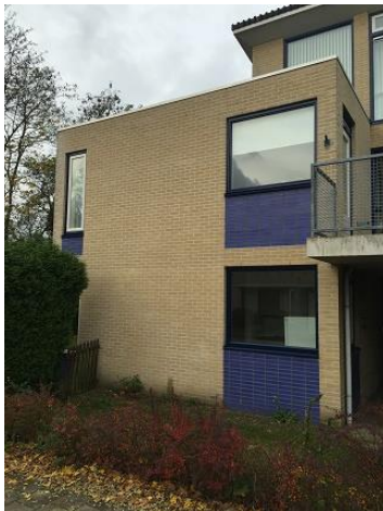
Van Damstr. 61 t/m 75