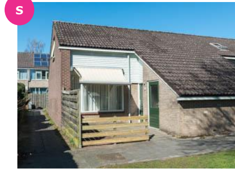
Trashorst 85 t/m 99