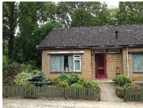
Monnikenstr. 1 t/m 7 en 18 t/m 24