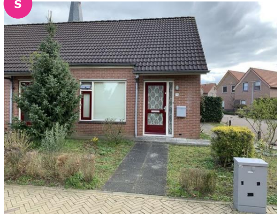
Bobbinkstraat 14 t/m 22