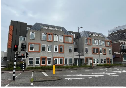
Keppelseweg 6-18, 6-19 en 6-21