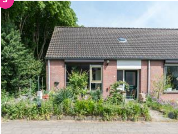
Looiersveld 1 t/m 21 en 2 t/m 16