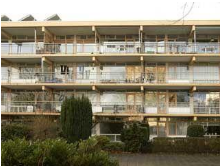
Ed. Schilderinkstr. 21 t/m 75