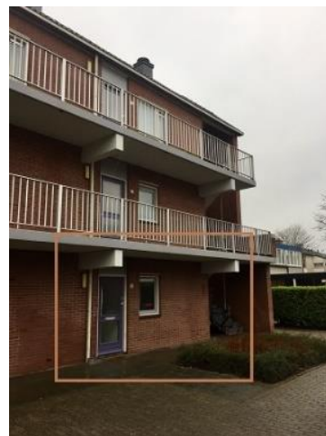
Ampsen 84 t/m 90