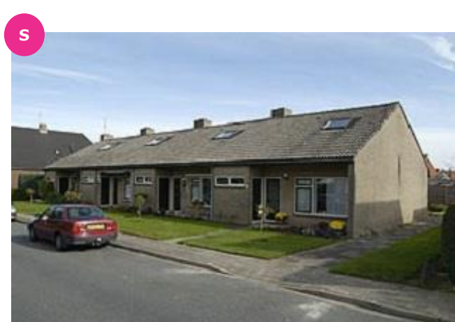
Cingelwal 47 t/m 53