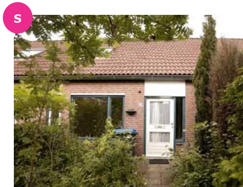
Borneostraat 20 t/m 26