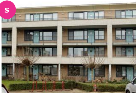
Hof van Cambridge 35 t/m 143