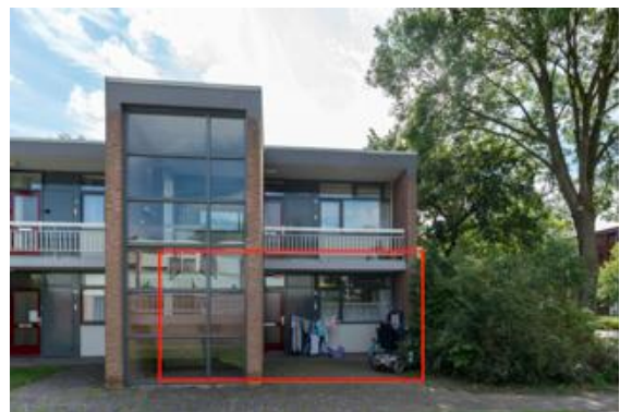
Staringstraat 1 t/m 47