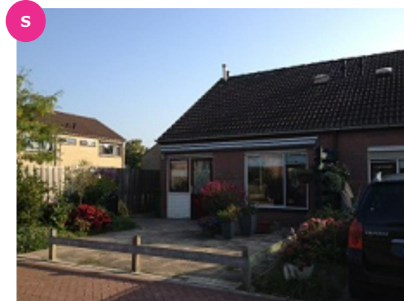
H. Addinkstraat 2 t/m 20

Het dorp Steenderen hoort bij de gemeente Bronckhorst. Er wonen ongeveer 2.000 inwoners. In het dorp kun je terecht voor de dagelijkse boodschappen. Er is een school en het dorp en haar omgeving bieden mogelijkheden voor sport- en recreatiemogelijkheden waaronder een verwarmd buitenzwembad en een prachtig uiterwaardengebied net buiten het dorp.