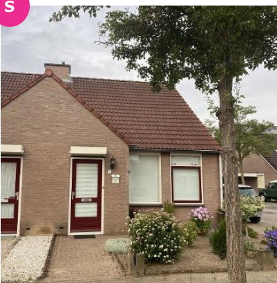
Moerbeibloesem 2 t/m 28 en 1 t/m 25