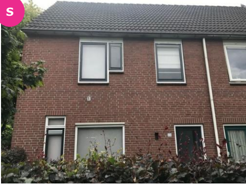
Koemate 22 t/m 28