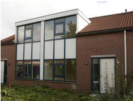
Kersebloesem 33 t/m 49