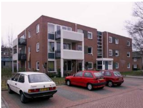
Brederostraat 1 t/m 21

Er wonen zo'n 6500 inwoners in de wijk Overstegen, waarvan een groot deel 65 jaar of ouder is. Maar er is zeker ook sprake van vergroening. Overstegen kenmerkt zich door het open karakter, het vele groen, het volwaardige winkelcentrum en de diverse voorzieningen in de wijk. Het ecologische natuurpark Overstegen met de vrij rondlopende Schotste Hooglanders is de trots van de wijk.