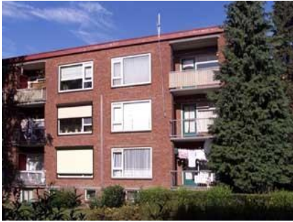
Leerinkstraat 146 t/m 288

De wijk Noord bestaat uit verschillende buurten. Er zijn zowel zeer ruim opgezette buurten als buurten met een hoge bebouwingsdichtheid. Ondanks dat heeft de wijk een tamelijk groen karakter. Het park Horsten ligt als een groene long in de wijk. Het westelijk deel van de wijk grenst direct aan de Kruisbergse bossen. De wijk kent een aantal actieve wijkverenigingen, sportverenigingen, twee basisscholen en een instelling voor het voortgezet onderwijs. Er zijn over de wijk verspreid een tiental speelvoorzieningen.