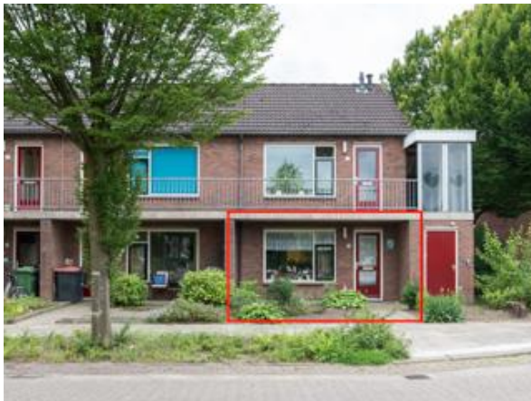
Kon. Julianalaan 4 t/m 8