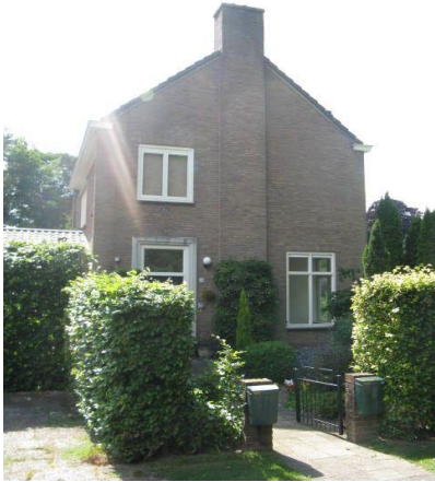
Oude Zutphenseweg 5