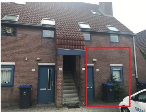
Blokhuislaan 226 t/m 248