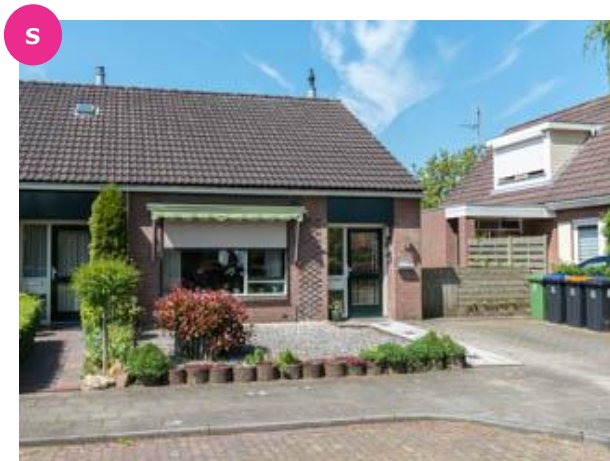
Beekseweg 6 t/m 6D