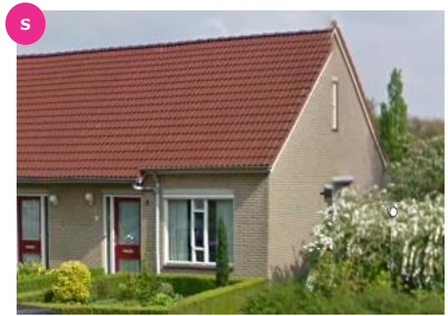
Esdoornstraat 8 t/m 20