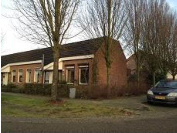
Burg. Heersinkstraat 26 t/m 48