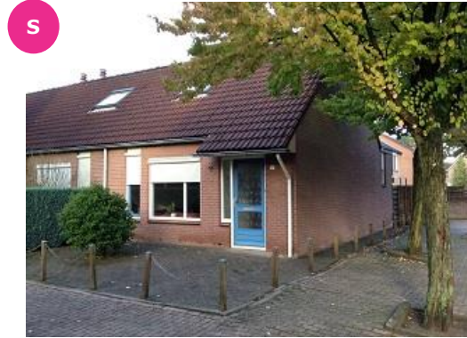
Ampsen 16 t/m 22