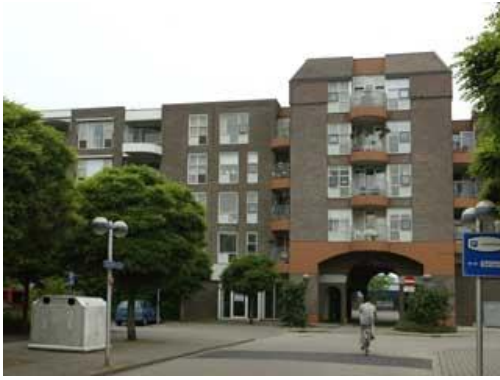
Schouwburgplein 132 t/m 222