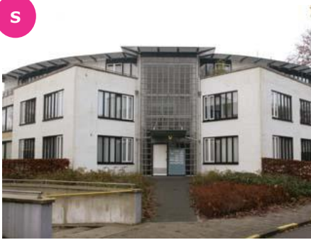
Mullerstraat 2 t/m 150