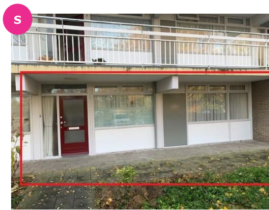
Marsmanstraat 12 t/m 120