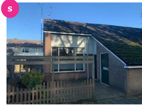
Markhorst 85 t/m 99