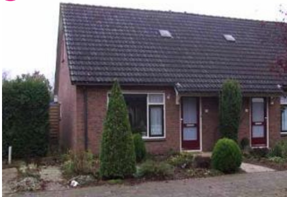
Leeuwencamp 17 t/m 23