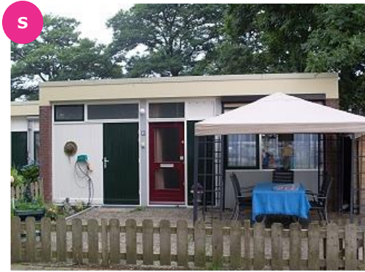
Begoniastraat 2 t/m 40