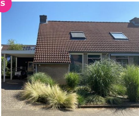
Perzikbloesem 1 t/m 11, 37 t/m 45