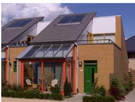
Harz 3 t/m 101