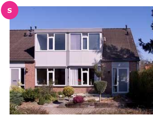
Van Reenenlaan 2 t/m 16 en 1 t/m 29

Er wonen ongeveer 2.800 inwoners in Schöneveld, waarvan relatief veel mensen 65 jaar of ouder zijn. In de wijk bevindt zich er onder andere een buurtsuper (de Spar), een tuincentrum, basisschool en een praktijkschool voor voortgezet onderwijs. In Schöneveld Noord is een groep bewoners actief die jaarlijks activiteiten voor en door de wijk organiseren.