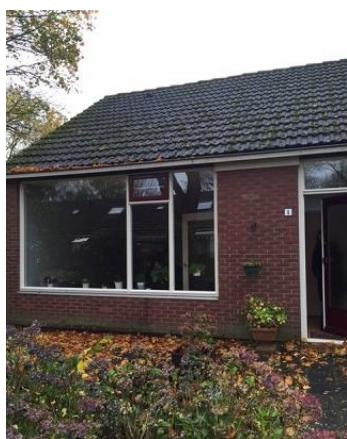
Van Bommelstraat 1 t/m 35