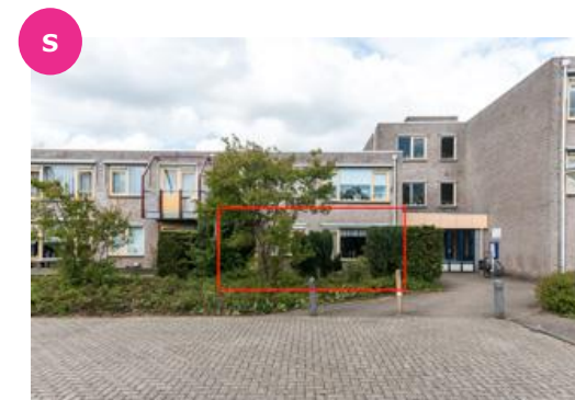
Bramenhof 1 t/m 113