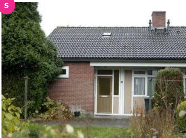
Margrietlaan 2 t/m 12

Hummelo is een dorp met zo'n 1.600 inwoners en valt onder de gemeente Bronckhorst. Voor de benodigde voorzieningen kunt u in het dorp terecht. Er is onder andere een supermarkt, een bakker, horeca, een bloemenzaak en er zijn diverse zorgvoorzieningen. Er zijn goede openbaar vervoer voorzieningen waaronder de buslijndienst naar Doetinchem, Doesberg, Arnhem en Zutphen.