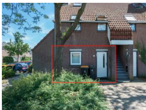
Surinamestraat 20 t/m 34