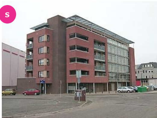
Erdbrinkplein 10 t/m 64