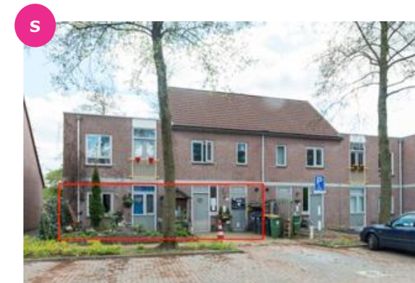
Wildenborch 139 t/m 152