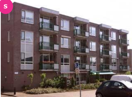
Amphionstraat 90 t/m 116