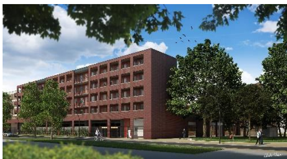
Stationsstraat 6A t/m 12H