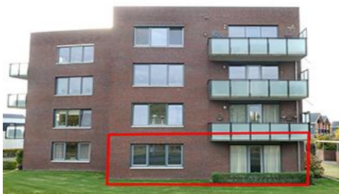
Asterstraat 100 t/m 114