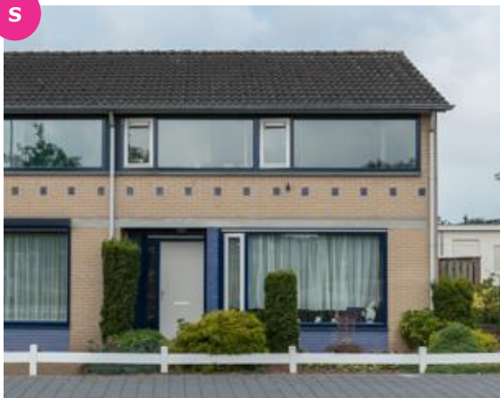
Hoofdstraat 15 t/m 27