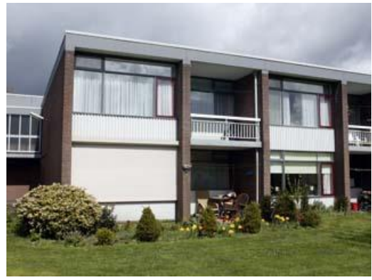
Beetsstraat 1 t/m 59