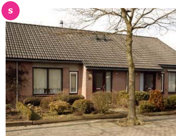
Fr. Roesstraat 19 t/m 23