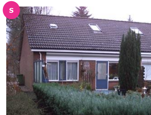
Bunderhorst 158 t/m 162