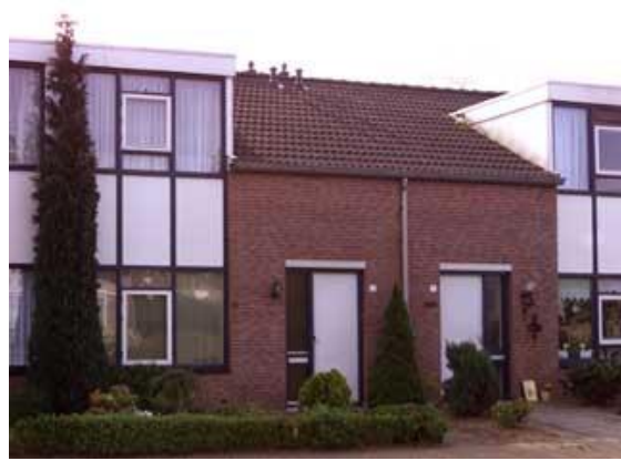
Gieterijstraat 11 t/m 27