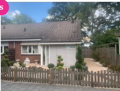
Grevengoedlaan 14 t/m 50