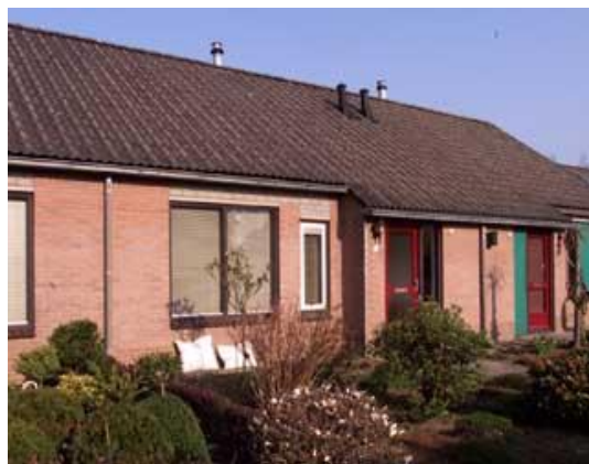
Hamminkstraat 2 t/m 6