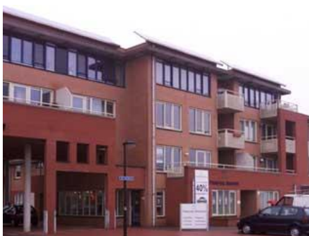
Hof van Rome 1-01, 31-01 en 33-01