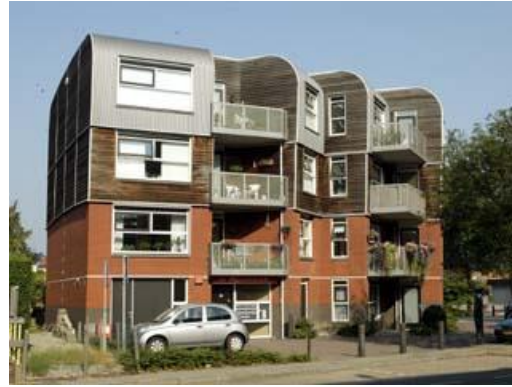
Steinlaan 1-01 t/m 1-11