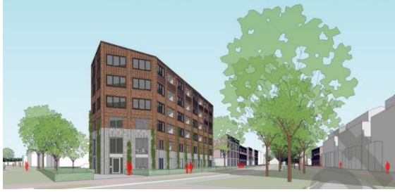
In aanbouw: Ruimzichtlaan, 22 app