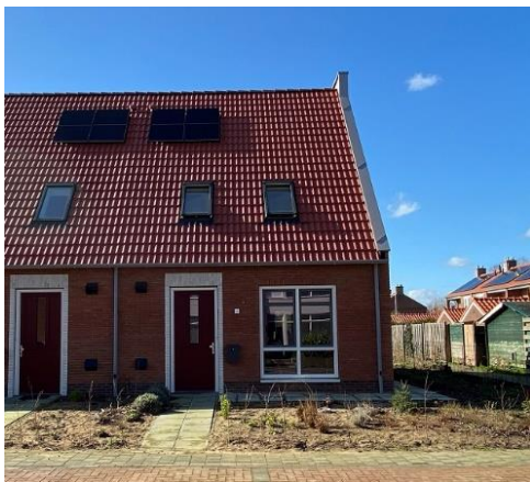
Ruyslaan 2 t/m 16