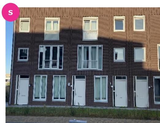
Ruimzichtlaan 111 en 117