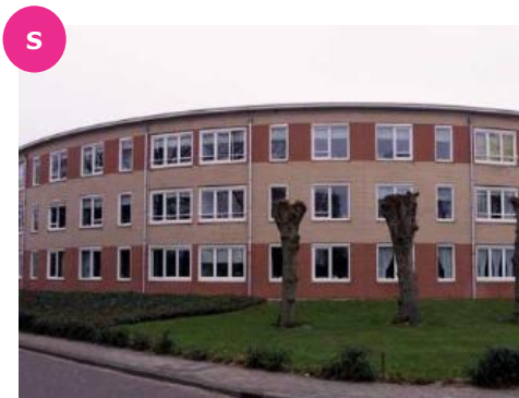
Atjehstraat 2 t/m 76