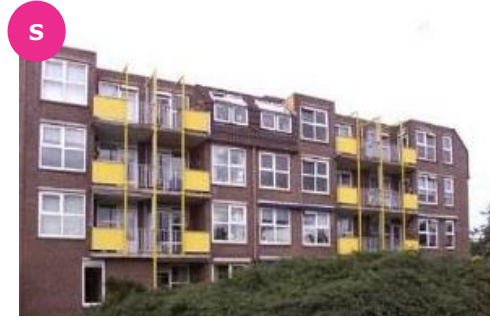
Gasthuisstraat 98, 102 en 106