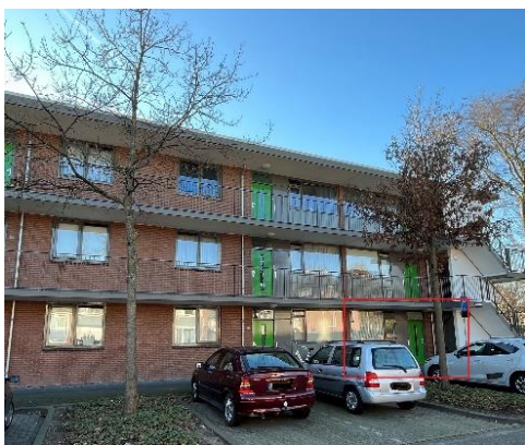
Leliestraat 10 t/m 80