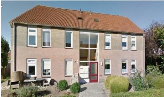
St. Martinusstr. 4 en 6