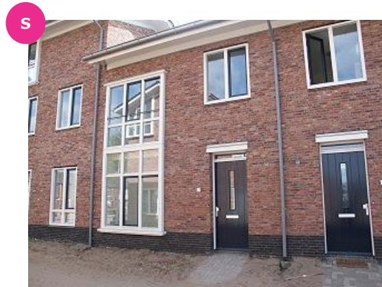
Zonnebloemstraat 49 t/m 55 en 30 t/m 40