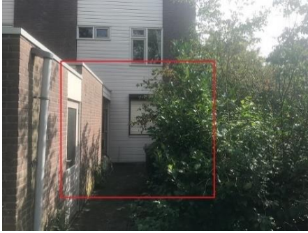
Nieuweweg 145 t/m 213, Sumatraplein 34 t/m 56