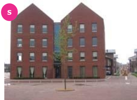
Klaproosstraat 22 t/m 36