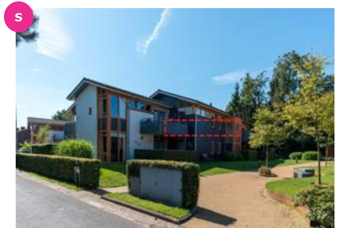
A.G. Noijweg 4 t/m 10C