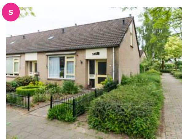
Weversveld 2 t/m 20