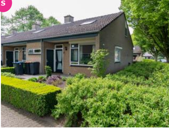
Pr. Mauritsstraat 21 t/m 59 en 10 t/m 28