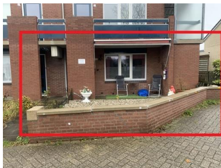
Van Damstr. 28 t/m 34 en 60 t/m 66