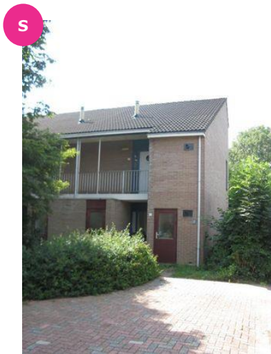
Slotlaan 146 t/m 156