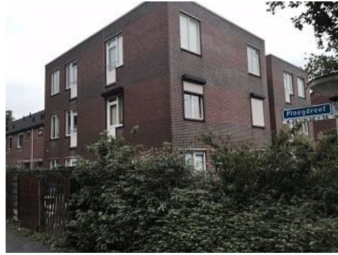
Ploegdreef 20 en 22