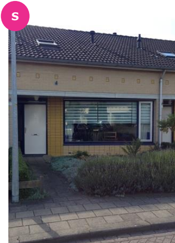
Van Damstr. 18-01 t/m 18-12