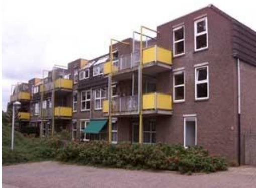
Prinsenhof 2, 4, 14, 24, 26, 36