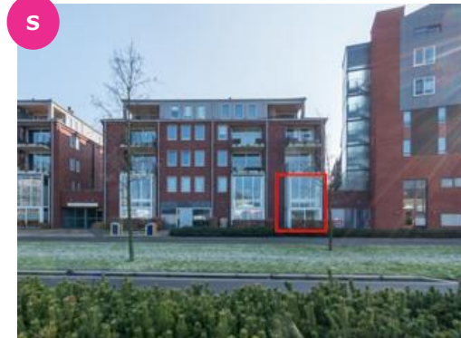
Ruimzichtlaan 60 t/m 102, 116 t/m 122