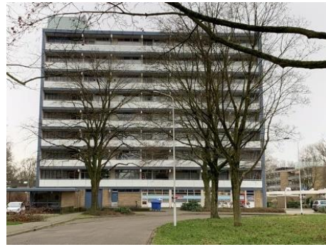
Houtsmastraat en 13 t/m 63