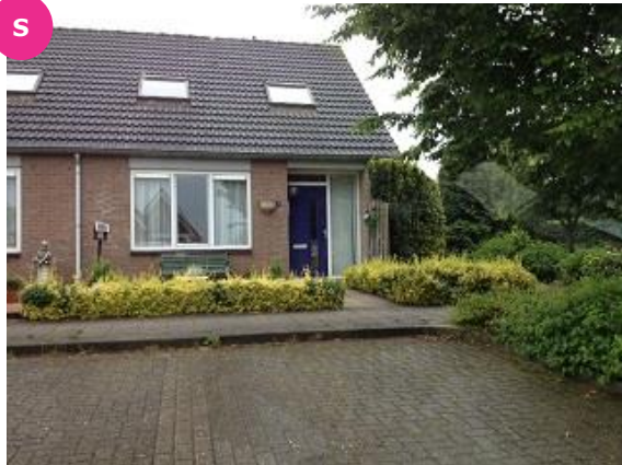
Kerkstraat 26 t/m 32A

Drempt is een klein dorp in de gemeente Bronckhorst en telt ongeveer 320 inwoners. Het dorp heeft een aantal voorzieningen zoals een basisschool, dorps huis en voetbalvereniging. Overige voorzieningen zijn vooral in Doesburg, Steenderen of Hummelo. Doesburg bevindt zich op fietsafstand. Openbaar vervoer met het dichtstbijzijnde treinstation bevindt zich in Dieren (10 km). Dankzij de goede ontsluitingen zijn steden als Doetinchem, Arnhem en Zutphen uitstekend te bereiken.