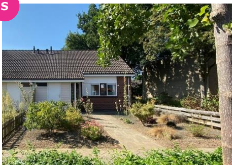
Montrealstraat 2 t/m 8