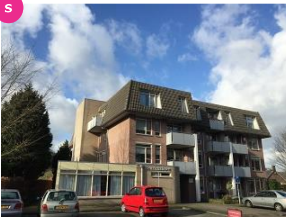
Keppelseweg 31-1 t/m 31-23

Het dorp Wehl hoort bij de gemeente Doetinchem en telt ongeveer 7.000 inwoners. Het beschikt over een gezellig centrum met een oud karakteristiek gedeelte en een nieuw gedeelte. Er is een hechte gemeenschap met een rijk verenigingsleven. Het Koningin Beatrixcentrum is het ontmoetingscentrum van Wehl met meerdere faciliteiten. De bereikbaarheid van Wehl is erg goed. Er is een treinstation met een verbinding naar Arnhem en Doetinchem en het is gelegen aan de snelweg.