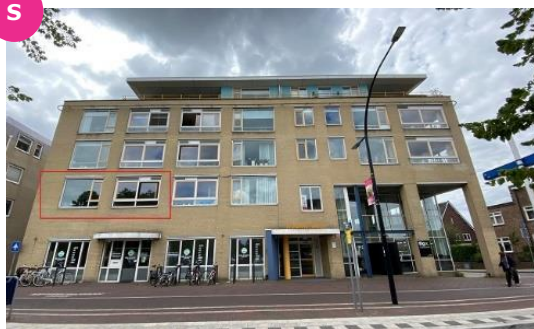
Terborgseweg 20-1 t/m 20-18