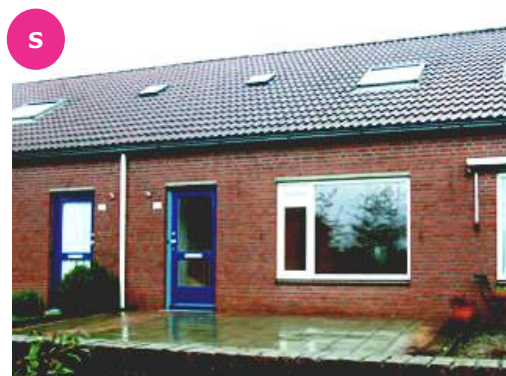
Eggedreef 114 t/m 136