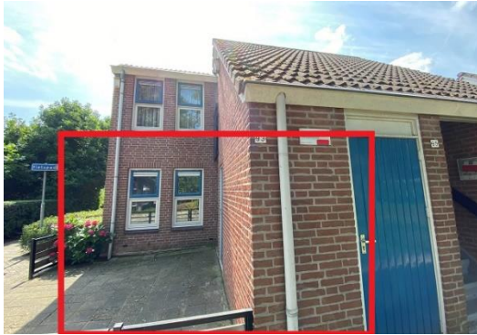
De Pol 93 t/m 121

Het dorp Uift is met 10.440 inwoners de grootste plaats in de gemeente Oude IJsselstreek en ligt ten zuidoosten van Doetinchem. Het dorp heeft een knus centrum met een uitgebreid winkelaanbod en een bloeiend verenigingsleven. Ook heeft het dorp een modern zorgcentrum.