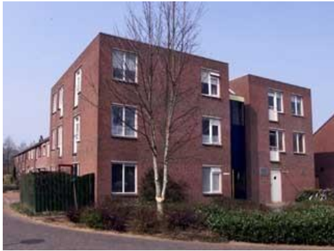
Tarwedreef 123 en 125