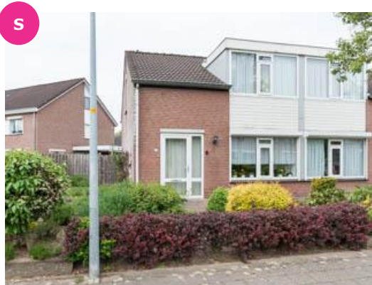
Elzenerf 25 t/m 47