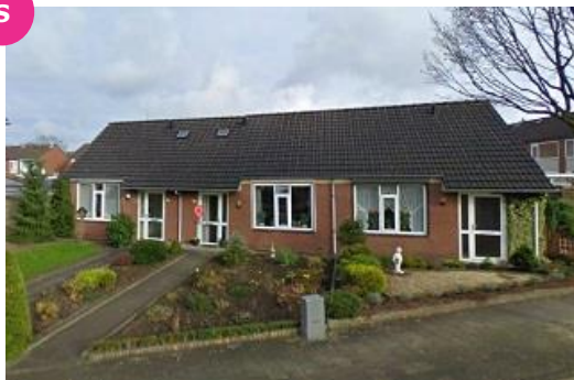
Ribesstraat 35 t/m 39, 73 t/m 77