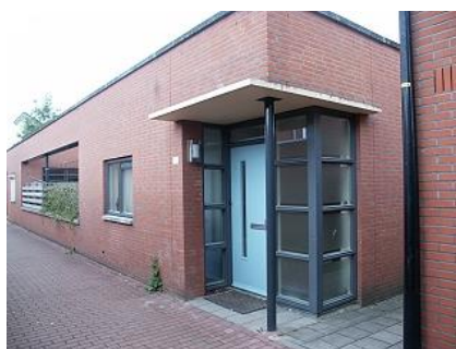
Hof van Parijs 174, 176 en 190