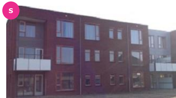
Ontwikkelstr. 38, 48, 56, 64, 66 en 106. Neerlandiastr. 37