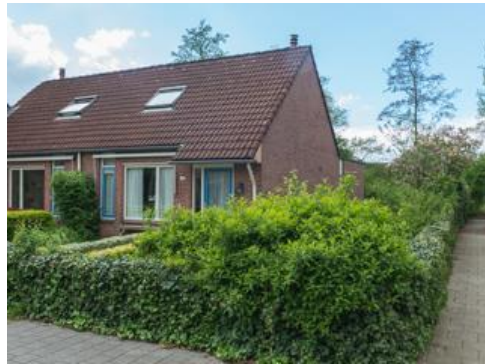
Bastinglaan 20 t/m 36