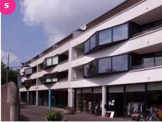
Korte Kapoeniestraat 58 t/m 100