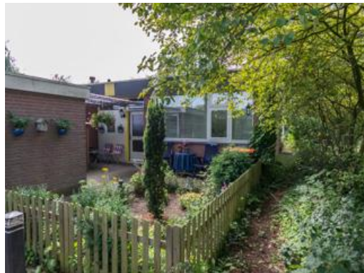
Plein ´40-´45 nr. 41 t/m 51, De Gaullestraat 26 t/m 36, Houtsmstraat 1 t/m 11 en 93 t/m 103