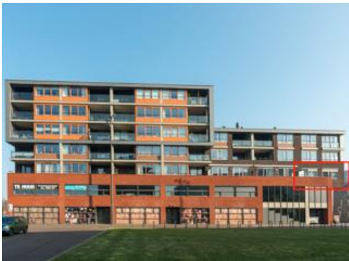
Ruimzichtlaan 2, 8, 10, 16 t/m 26, 32 t/m 38