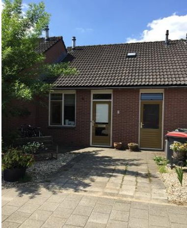
Burg. Cordesweg 1 t/m 13