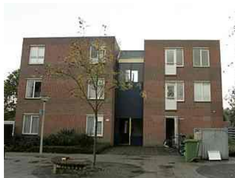
Sikkeldreef 1 en 3