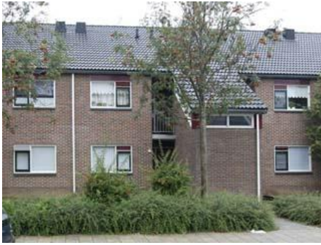
Sikkeldreef 87 t/m 177