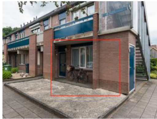
Pr. Christinastraat 14 t/m 26 (22 t/m 26)