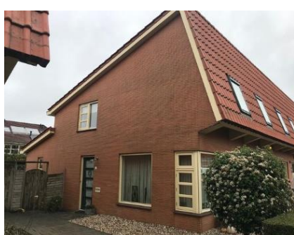
Ebro 15 t/m 75