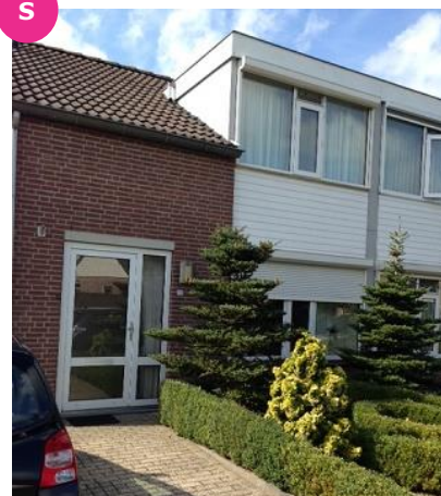
Diepenbroekstraat 35 t/m 45