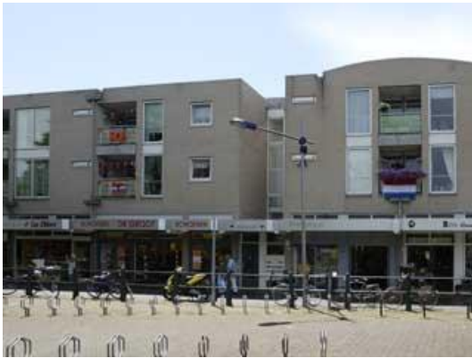
Nieuwstad 9-01 t/m 9-11

Tussen alle Doetinchemse wijken neemt het Centrum een aparte positie in. Het Centrum ligt op loopafstand van het gezellige stadscentrum van Doetinchem met allerlei voorzieningen zoals supermarkten, sfeervolle boetiekjes, restaurants, heerlijke terrasjes, openbaar vervoer, de schouwburg en de bioscoop. De uitvalswegen naar Arnhem en Enschede zijn binnen enkele autominuten bereikbaar. Er wonen ruim 4.300 inwoners in het centrum.