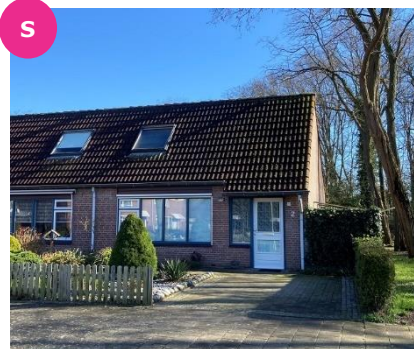
Borneostraat 2 t/m 8A