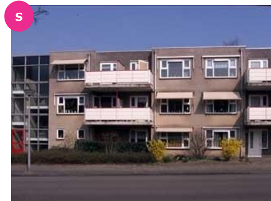
Amphionstraat 32 t/m 70