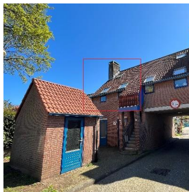
Pompenhof 3 t/m 75