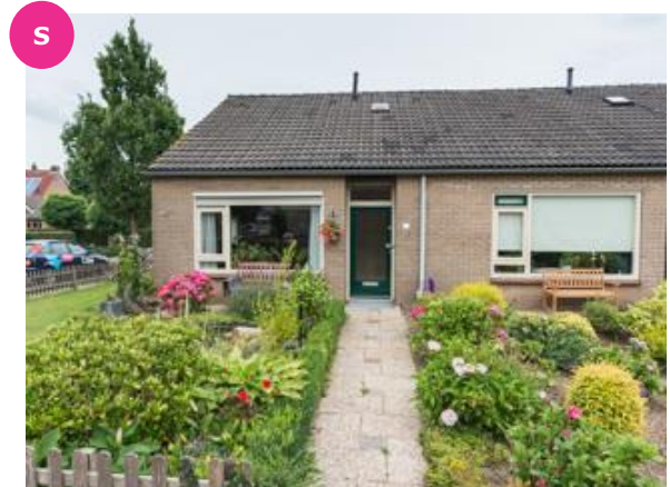
Kon. Wilhelminastraat 16 t/m 50 en 74 t/m 94