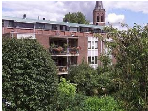
Korte Kapoeniestraat 13 t/m 19, 25 t/m 31