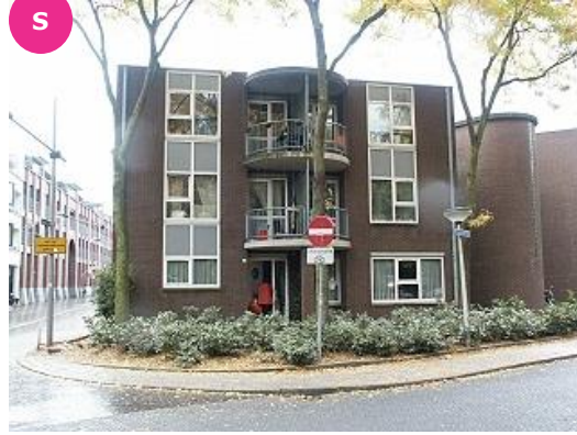
Kapoeniestraat 17 t/m 25