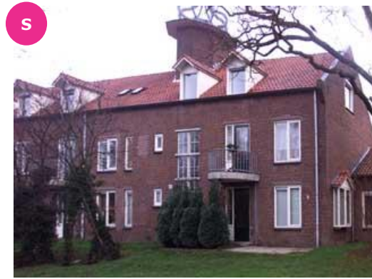
Brouwerskamp 27-01 t/m 29-04