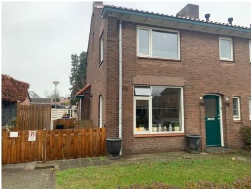
Lampongstraat 1, 7 en 11