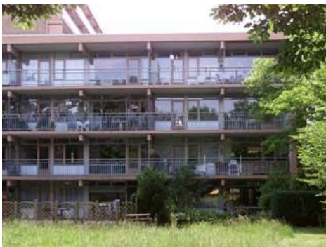
Houtsmastraat 2 t/m 246