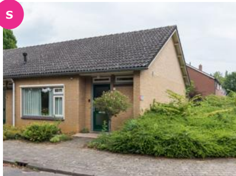
Plenariumstr. 2 t/m 16