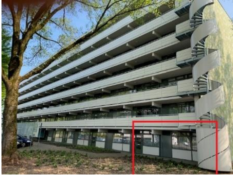
Caenstraat 2 t/m 208 S Caenstraat 210 t/m 624