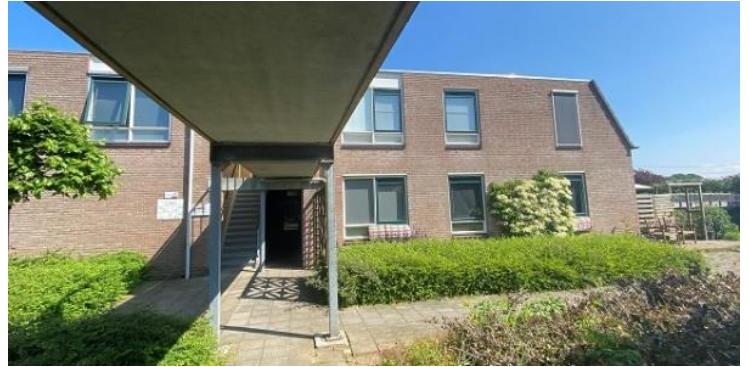
Allee 7 t/m 121, 4 t/m 130 Allee 20 t/m 26 en 67 t/m 79