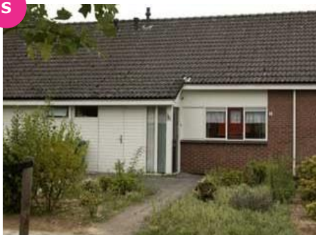
Canadaparklaan 33 t/m 51