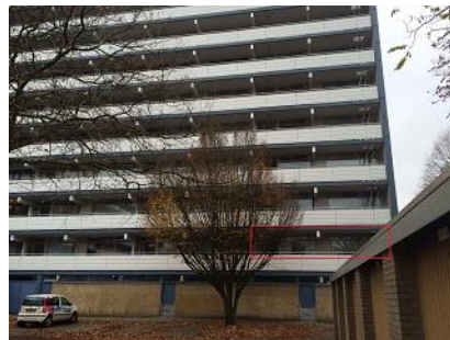
Ed. Schilderinkstraat 79 t/m 89, 284 t/m 306 S