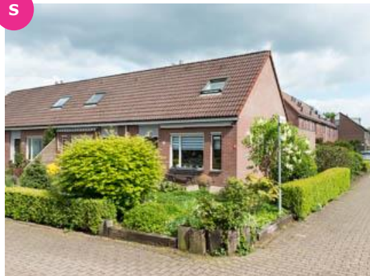
Wiersse 54 t/m 60