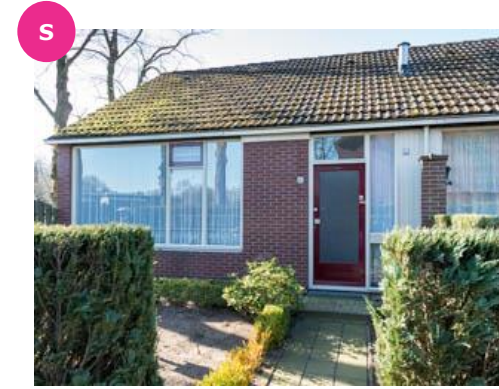
Oude Rozengaardseweg 187 t/m 193