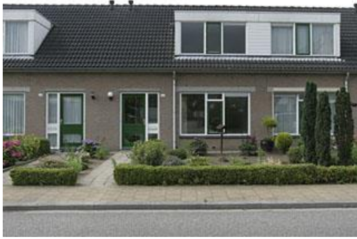
Smelterijstr. 2 t/m 12