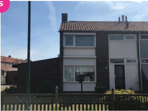
Koemate 46 t/m 56 Nonnenmate 8 t/m 14