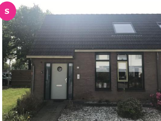
Bastinglaan 26 t/m 36, 61 t/m 83, 109 t/m 119