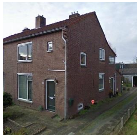
Pr. Irenestraat 3 en 5 en Warnerstraat 42