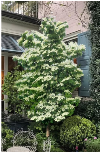
Japane Kornoelje ( Cornus kousa 'Green Dwarf' )