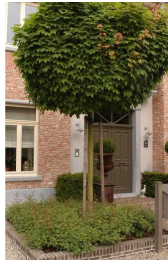
Bolusdoorn ( Acer campestre 'Nanum' )