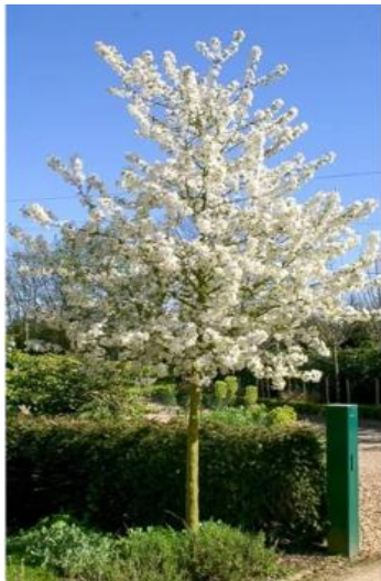
Sierappel ( Malus Evereste )

Een boom kan erg mooi zijn, maar ook voor veel onderhoud zorgen. Bomen die betaalbaar zijn, niet te groot worden en daardoor makkelijk te onderhouden zijn, zijn bijvoorbeeld: